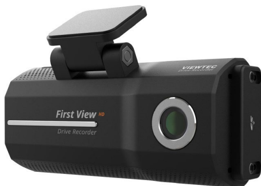
ドライブレコーダー FirstView VRHD