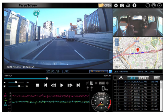
専用ビューワーソフト

クラウド対応のFirstViewシリーズ最上位モデル！ イベント動画は発生すると即時メール通知、常時録画 動画をリクエスト・ダウンロードすることも可能！