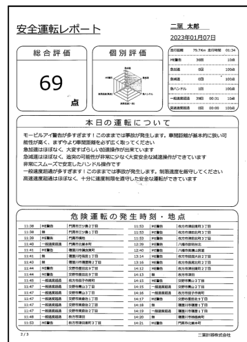
安全運転レポート (イメージ)